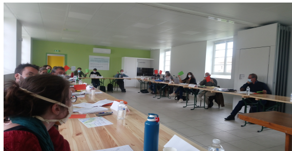
Groupe de travail VP en présentiel à Meursac